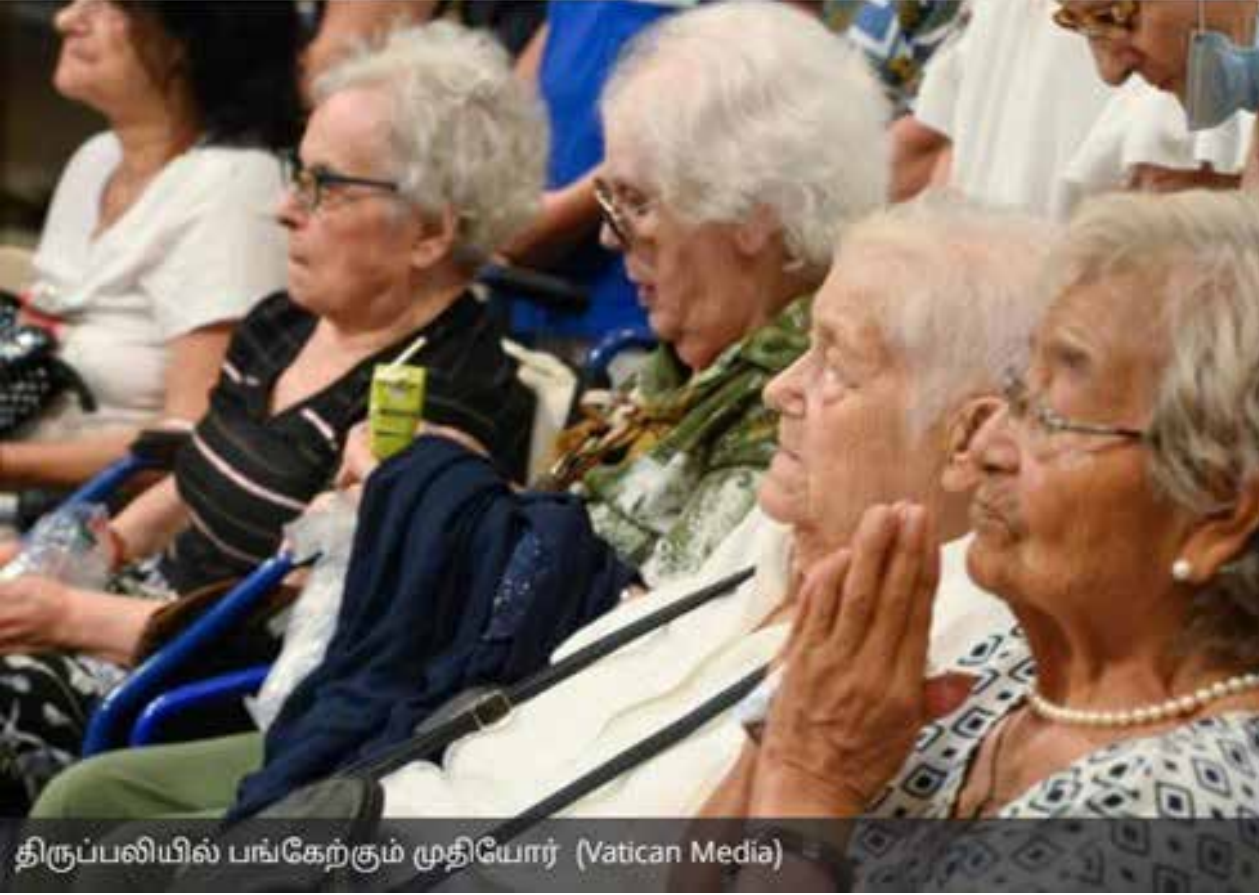
திருப்பலியில் பங்கேற்கும் முதியோர்

நமதாண்டவர் இயேசுவின் தாத்தா பாட்டியும் அன்னை மரியாவின் பெற்றோர்களுமான தூய சுவக்கீன் அன்னா இவர்களின் திருவிழா ஒவ்வொரு ஆண்டும் ஜூலை 26 ஆம் நாள் சிறப்பிக்கப்படுவதை முன்னிட்டு, ஒவ்வொரு ஆண்டும் ஜூலை மாதத்தின் நான்காம் ஞாயிற்றுக் கிழமையை உலக தாத்தா பாட்டிகள் மற்றும் முதியோர் நாளாக திருஅவையில் நாம் கொண்டாடி மகிழ்கின்றோம்.