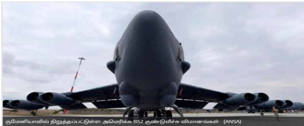
ருமேனியாவில் நிறுத்தப்பட்டுள்ள அமெரிக்க B52 குண்டு வீச்சு விமானங்கள்